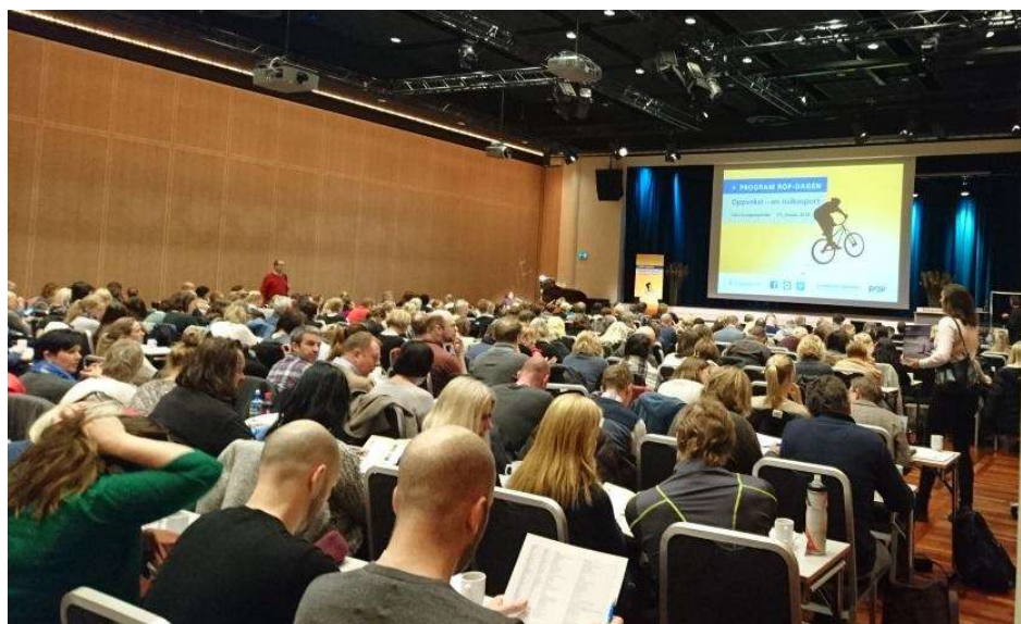
ROP-dagen 2016: Mer enn 350 deltakere var tilstede på ROP-dagen 2016. Temaet for dagen var «Oppvekst – en risikosport?»

Undervisning, opplæring og foredrag ved nasjonale og internasjonale kurs og konferanser skal fortsette også i 2017.